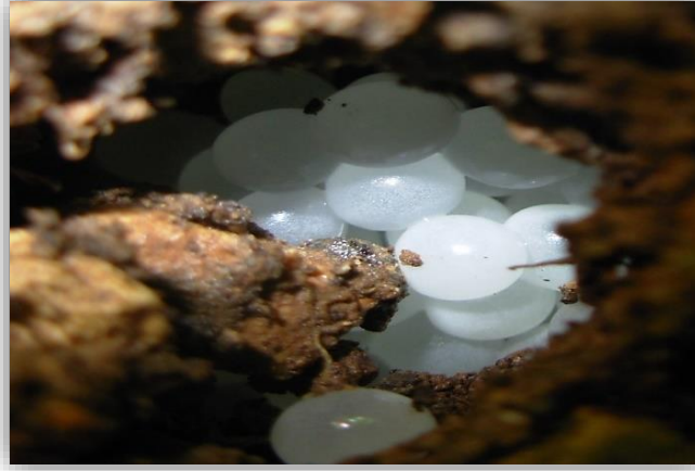
" صورة توضح بويضات القواقع الارضية بالتربة"

❖ وتضع الأفراد عدد من البيض يختلف باختلاف الأنواع حيث يصل إلى 100 بيضة في قوقع البرسيم الزجاجة بينما يكون هذا العدد حوالي 50 بيضة في قوقع الرمال الصغير ، 80 بيضة في قوقع الحدائق البني ذو الشفة العريضة وبعد إتمام وضع البيض يقوم الحيوان بتغطيته بالمادة المخاطية التي يفرزها و تسمى (mucus).