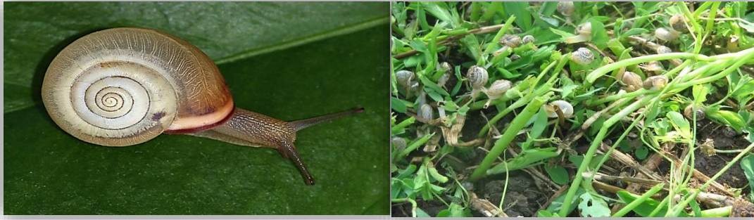
" قوقع البرسيم الزجاجي "

وهو الاكثر شيوعا وينتشر بأعداد كبيرة في حقول البرسيم والخضروات والقطن والقمح وبعض نباتات الزينة ويقضي هذا النوع فترة الراحة الصيفية مختبئاً أسفل الحشائش علي جسور الترع والمصارف والقني والبتون علي اعماق تصل الي 5 سم ثم يبدأ نشاطه مع بداية موسم الخريف وحتى نهاية موسم الربيع في الحقول الزراعية الأخرى وسمي بالزجاجي للونه الابيض نصف الشفاف.