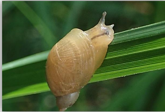
" القوقع المكروني "

قوقع متوسط الحجم وهو قوقع بر مائي يهاجم حقول البرسيم والخضروات والخس حيث يتواجد ويتكاثر طوال العام ويهاجم حقول البرسيم والخضروات في فصل الشتاء