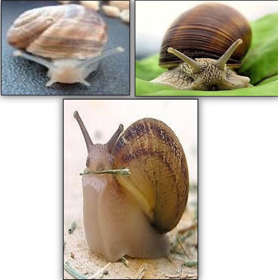
"منظر امامي للقوقع"

هذه الطائفة بالبطنقدميات او الحيوانات التي منطقة قدمها علي سطحها البطني