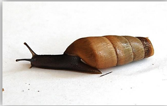
" قوقع مشطوف الصدفة "