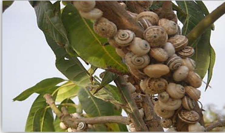
"إصابة جذوع الاشجار بالقواقع الارضية"