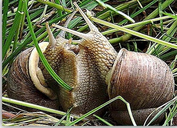
" تكاثر القواقع الارضية "

القواقع والبزاقات حيوانات خنثوية ولكن لابد من تقابل حيوانين معا لكي يحدث الاخصاب ويتم تبادل الحيوانات المنوية فيما بينهما وغالبا ما تنضج الحيوانات قبل البويضات في معظم الانواع او بعد عملية لقاء الحيوانين ويتم ذلك خلال الخريف والربيع