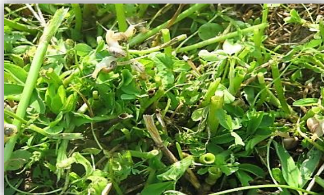
" إصابة القواقع لمحصول البرسيم"