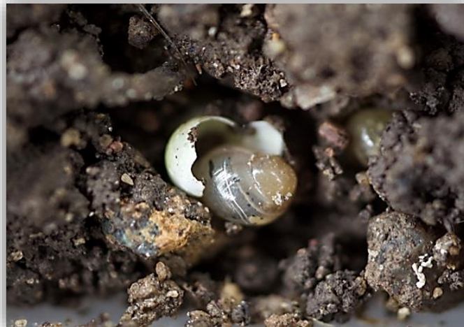
" لحظة خروج القوقع من البيضة"

بعد حوالي 10 - 21 يوم حسب النوع يفقس البيض معطيا افراد صغيرة تشبه الامهات تماما ولكنها غير ناضجة جنسياً ويتم الفقس اواخر الخريف وبداية الشتاء. عند خروج الصغار مباشرة تتغذي علي غطاء البيض وعلي الشعيرات الجذرية للنباتات والمواد الدوبالية الموجودة في التربة.