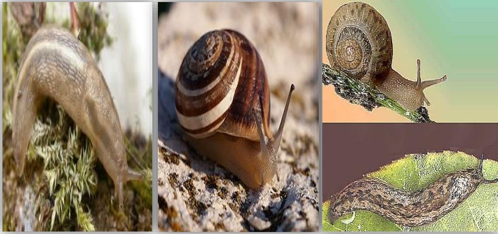
" صورة توضح القواقع الارضية والبزاقات "

مقدمة: تنتمي القواقع والبزاقات الأرضية إلى قبيلة الرخويات وهى عبارة عن حيوانات ذات أجسام رخوة غير مقسمة إلى حلقات لها رأس واضحة عليها زوجين من الملامس تسمى هذه الحيوانات بالبطن قدميات حيث تزحف على بطنها بواسطة قدم كبير عليه أهداب كثيرة ويقوم القدم أيضاً بإفراز مادة مخاطية تساعد الحيوان على سهولة الحركة، وتتميز القواقع عن البزاقات بوجود صدفه جيرية على الظهر تختبئ داخلها عند الخطر أو وجود ظروف بيئية غير مناسبة أما البزاقات فهى عارية .