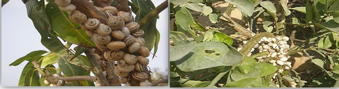
" إصابة جذوع الاشجار بالقواقع "

2- ميزورول ار بى 2% (طعم سام) 4 كجم/فدان.