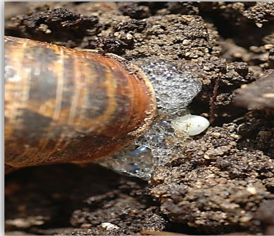
" عملية وضع البيض للقواقع الارضية "

بعد عملية الاخصاب يقوم كل حيوان ببناء حفرة في التربة المفككة وهي حفرة سطحية في معظم الانواع و ذلك خلال الخريف حيث يوضع البيض داخل حفرة فى التربة على عمق 3 - 5 سم وبعض الانواع الأخرى قد تحفر انفاقاً عميقة لوضع البيض فيها.