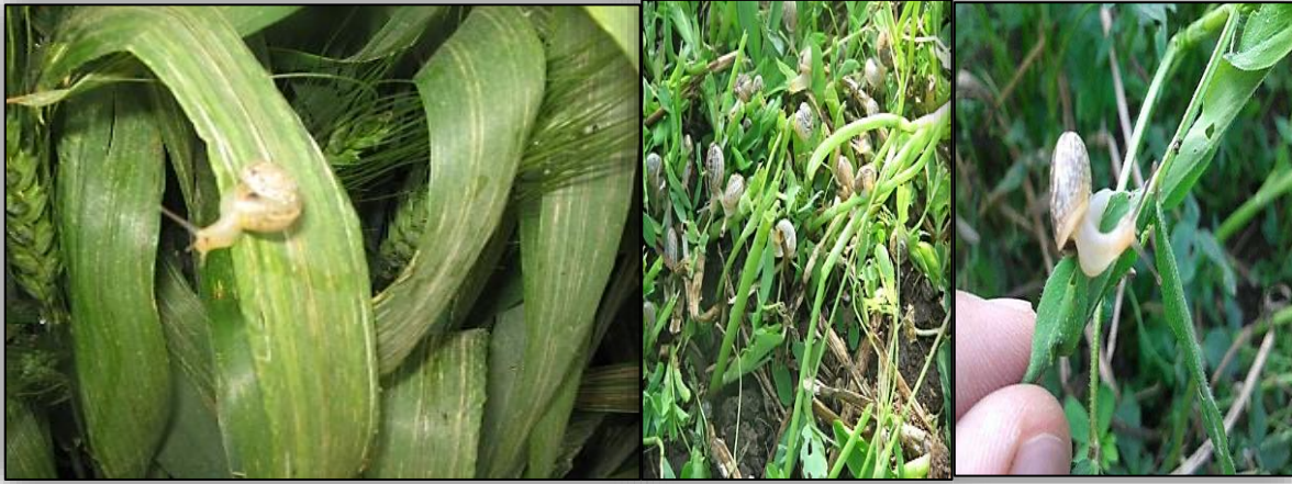
" اضرار القواقع علي القمح والبرسيم "

كما أن محصول الأرز يصاب ببعض أنواع القواقع حيث تقوم بالتغذية علي القمم النامية للبادرات وكذلك ينتقل الي زراعات جميع الخضروات المجاورة