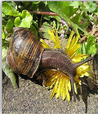
" إصابة نباتات الزينة بالقواقع "