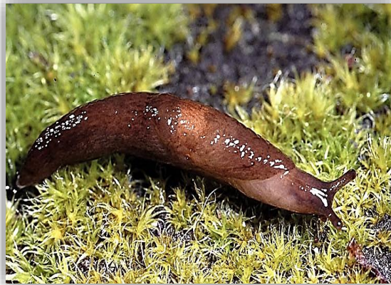
" صورته توضح شكل بزاقة Deroceras leave "

وتنتشر هذه البزاقات بكثرة على نباتات الزينة وداخل الصوب الخشبية ومعظم أشجار الفاكهة. وتم حصر قوقع البرسيم الزجاجي وقوقع الحقائق البني وبعض انواع البزاقات آفات ضارة جدا بصعيد مصر