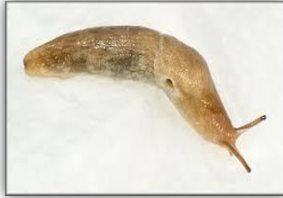
" صورته توضح شكل بزاقة Deroceras reticulatum "

وتنتشر بكثرة على نباتات الزينة وداخل الصوب الخشبية وأيضا على أشجار الفاكهة