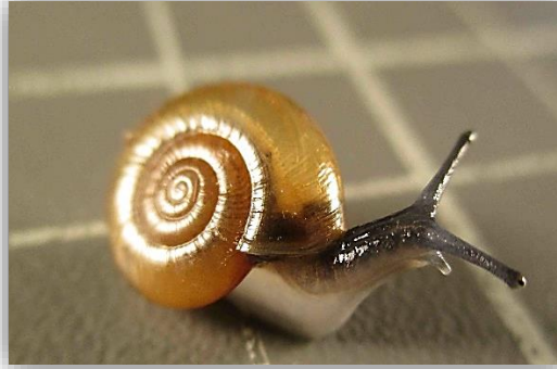
" قوقع زجاجي الصدفة "