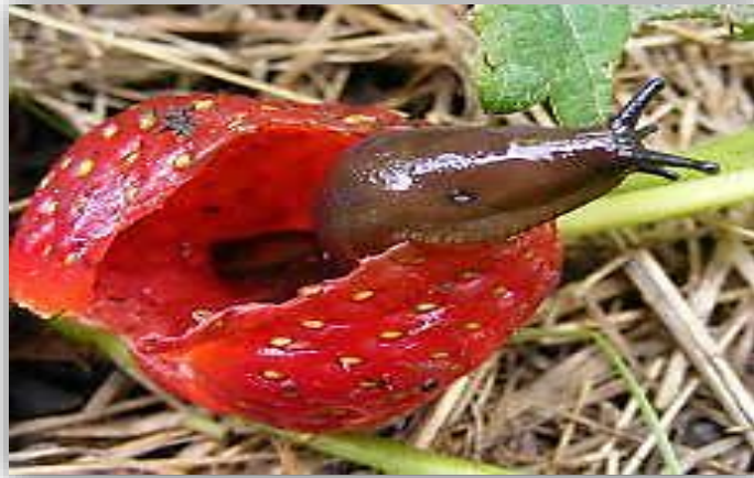
" إصابة القواقع الارضية لمحصول الفراولة"