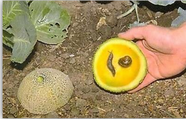
" ثمار كنتالوب تحتوي علي قواقع وبزاقات"