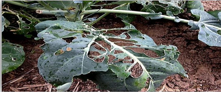
"اصابة نبات الكرنب بالقوقع"