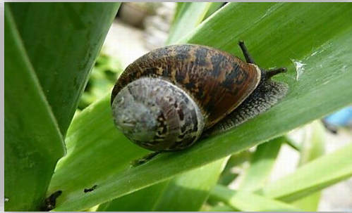
"قوقع الحشائش ( القوقع أبو سرّة أو قوقع الرمال الصغير )"

ويتميز هذا النوع بوجود سرّة ويميل لون الصدفة الي الابيض وعليها حلزون ملون بوضوح والقمة سوداء وينتشر هذا النوع على العديد من اشجار الفاكهة مثل الجوافة والموالح والمانجو والموز والنخيل ويزداد ضرر هذا النوع من القواقع خلال اشهر الربيع والخريف.