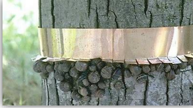
"رقائق من نحاس لمنع زحف القواقع علي جذوع الاشجار"